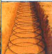
Ringgrabenkollektor