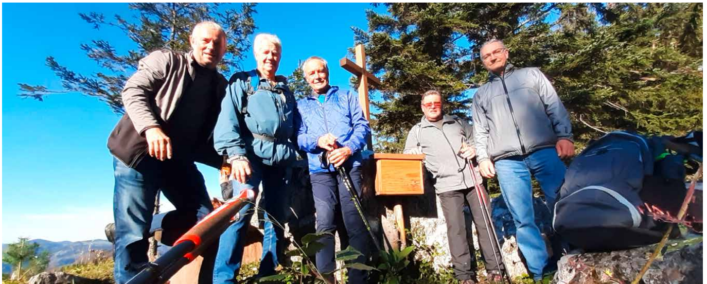
Das Team der Volksbank-Wanderfreunde beim Gipfelkreuz des Grüblkogels am Schlagerboden.

Fazit der Tour: Eine traumhafte Landschaft mit vielen gepflegten Bauernhöfen, Almweidewirtschaft und 360-Grad-Rundum-Blicke. Den Folder und die Wanderkarte gibt es übrigens kostenlos am Gemeindeamt St. Anton an der Jeßnitz, T. 07482/48240.