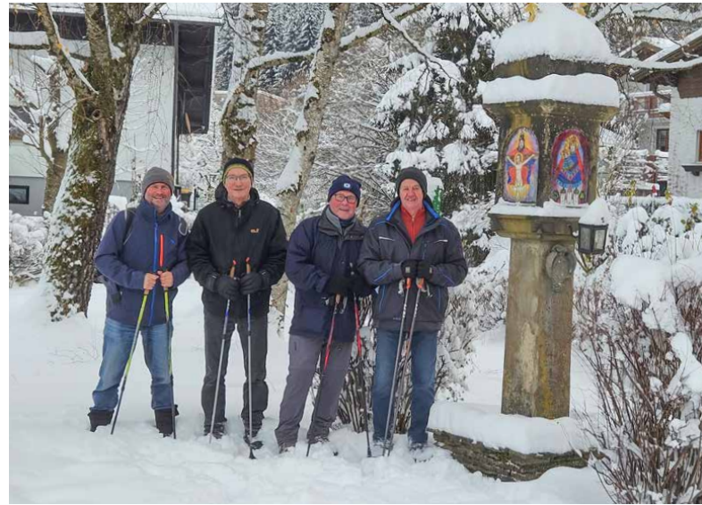
Das Volksbank-Wanderquartett vor der historischen Antoni-Säule.