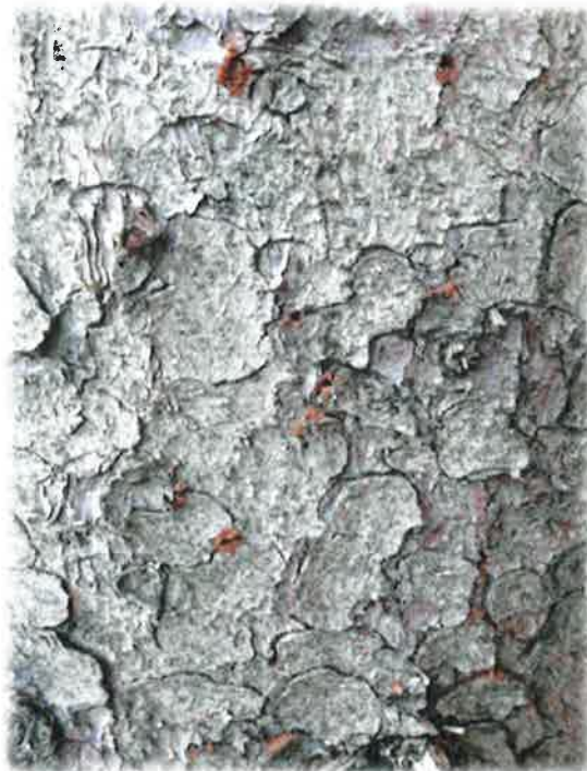
Vom Buchdrucker frisch befallene Fichte